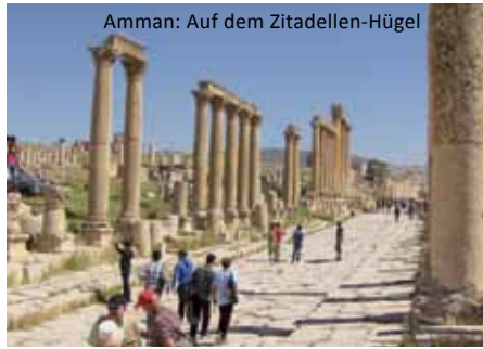
Amman: Auf dem Zitadellen-Hügel

Tagesausflug nach Jerash, einer unter den Römern im 1. Jh. n. Chr. wichtigen Handelsstadt und Konkurrenz zum älteren Petra, wo heute noch eine Fülle an Bauwerken von einer damals regen Bautätigkeit zeugen. Unter