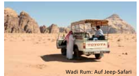
Wadi Rum: Auf Jeep-Safari

Nach dem Frühstück Fahrt durch die Edom-Berge zum Wadi Rum, dem grössten Wadi Jordaniens mit bizarren Felsformationen aus Sandstein und Granit, vor 30 Millionen Jahren durch Erosion entstanden. Hier befinden sich auch Schauplätze der Arabischen Revolution in den Jahren 1917/18, in welche Thomas Edward Lawrence – bekannt als Lawrence of Arabia – involviert war. Nach einer 2stündigen