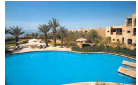
Mövenpick ZARA Spa: Hydropool

«Village»-Trakten untergebracht. Durch die Anlage schlängelt sich ein quirliges Bächlein bis zum Dorfplatz. Im Hotelrestaurant gibt es täglich zu jeder Mahlzeit reichhaltige Buffets und zusätzlich sind am Abend beim Dorfplatz 4 weitere Restaurants um das leibliche Wohl der Gäste besorgt. Badespass lässt sich in mehreren Frischwasser-Swimmingpools geniessen und im ZARA Spa (Eintritt US $ 35.– pro Tag/Person, wird für Massagen/Behandlungen angerechnet) gibt es nebst einem Hydropool zwei geheizte Becken mit Wasser aus dem Toten Meer, eines davon mit reduziertem Salzgehalt. Massagen und Behandlungen sind zusätzlich zu bezahlen. Die Dienste eines Arztes findet man in der hoteleigenen Clinic.