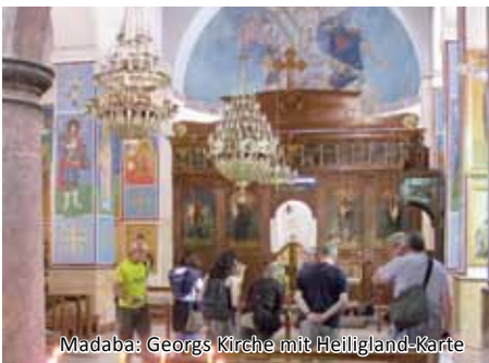
Madaba: Georgs Kirche mit Heiligland-Karte

Tagesausflug vom Toten Meer zum Berg Nebo, von wo aus Moses das gelobte Land gezeigt worden sein soll. Dann Besuch von Madaba mit der alten Landkarte des heiligen Landes als Bodenmosaik in der griechisch-orthodoxen Georgs Kirche. Weiterfahrt nach Amman zum orientalischen Mittagessen in einem lokalen Restaurant. Am Nachmittag Besichtigung der