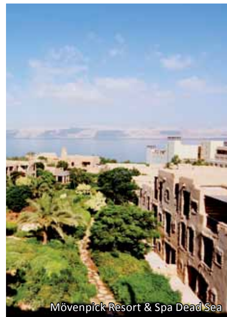
Mövenpick Resort & Spa Dead Sea